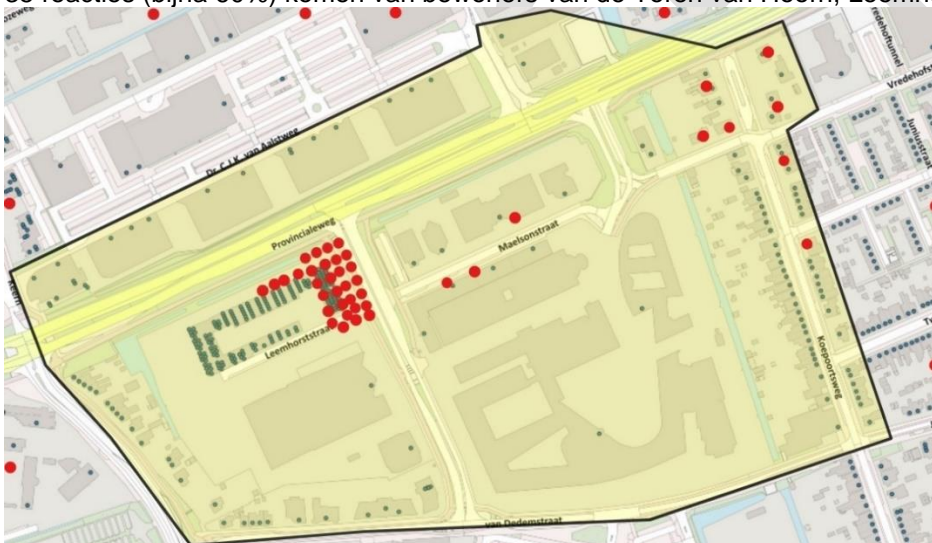
kaartje met verspreidingsgebied uitnodigingsbrief en herkomst reacties

50 Reacties (ruim 80%) komen van bewoners uit het gebied van de 350 adressen waar de uitnodigingen zijn bezorgd. 10 Reacties komen van buiten dat gebied. 35 reacties (bijna 60%) komen van bewoners van de Toren van Hoorn, Leemhorststraat 44-104.